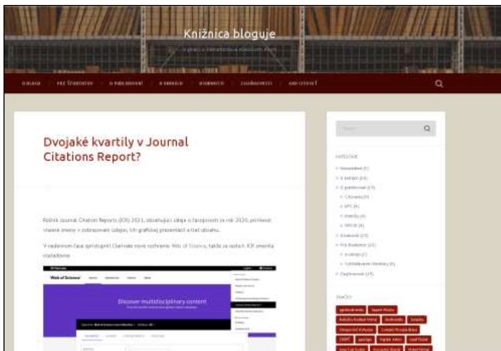
Obrázok č. 2: Článok v knižničnom blogu